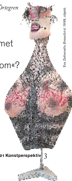
Eva Zettensalls Brestsbird, 1999, objekt.