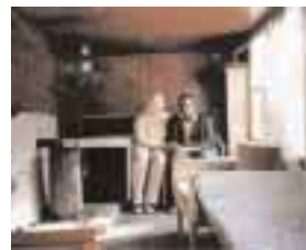
OMSLAG Esko Männikö, Organized Freedom , från utställningen Ars 001 på Kiasma, Helsingfors.