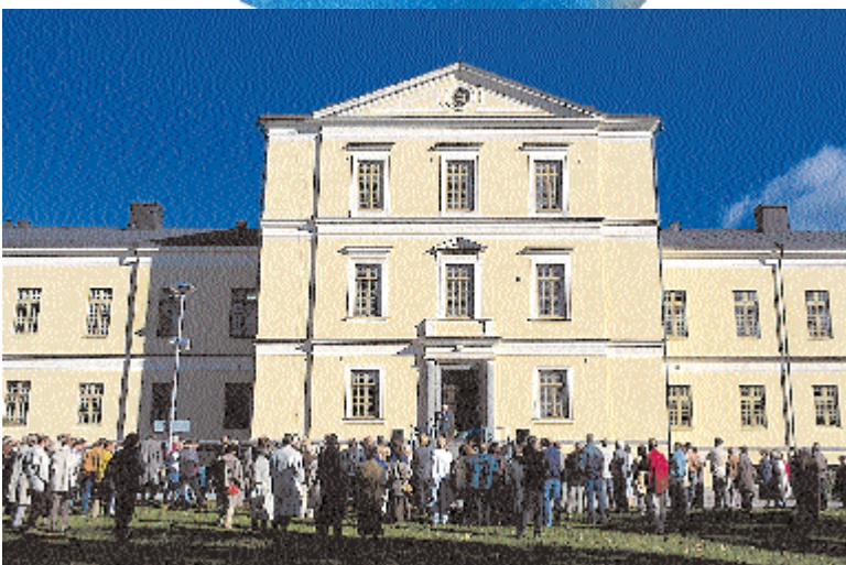
Exteriörbild från invigningen av Italienska Palatset, 1995.