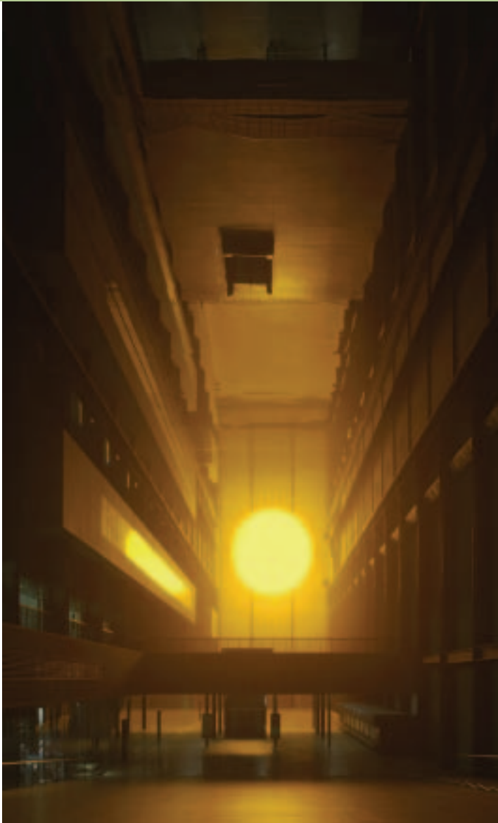
Olafur Eliasson, The Weather Project, installation på Tate Modern