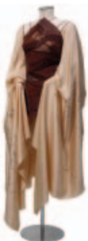
Design: Hjordis Augustsdóttir

KALENDARIVM ..... 49 Vinterns alla utställningar.